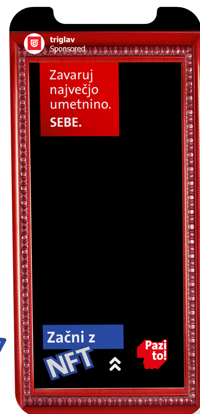
Primer: IG Story Ad

Vsak NFT nezamenljiv žetonček v realnem življenju.