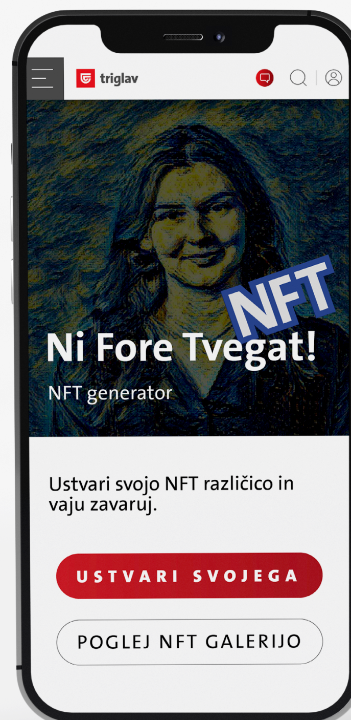
Primer: NFT Generator