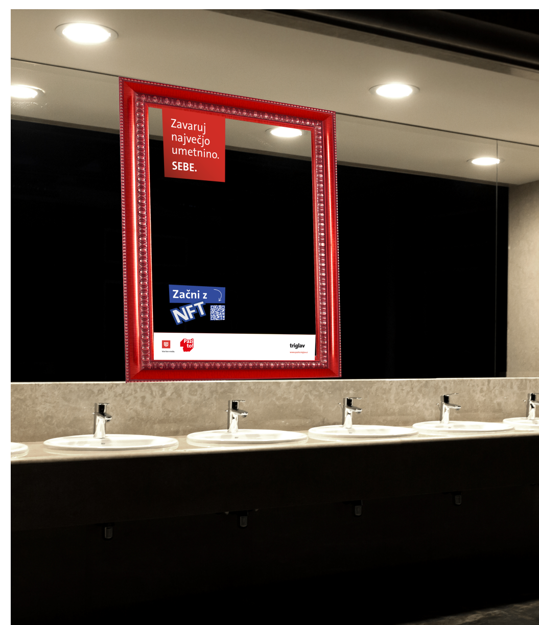
Primer: Oglaševanje v nočnem klubu